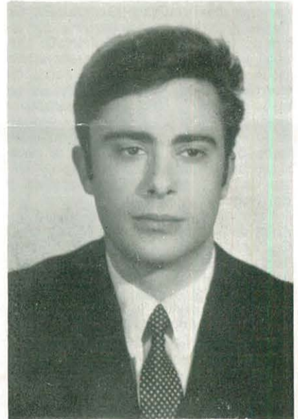
Hombre joven, muy competente y especializado en su carrera.

Miembro de la Asociación de Hídalgos a Fuero de España.